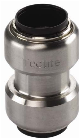
TS 270, Muffe I/I