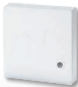
F 190 021