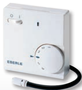
FR-E 525 31/i