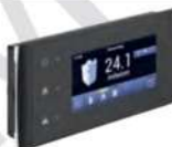
33 Touch Display • Passend für Eventura HVL 2.0 und HV