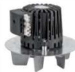
28 Rauchgasgebläsemotor • Passend für Eventura HVL 2.0 und HV • Mit Lüfterrad