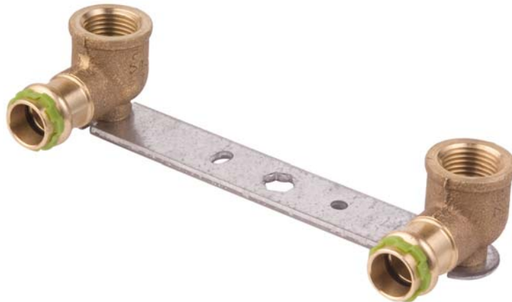
VC 4977 Montageeinheit gerade, 150mm