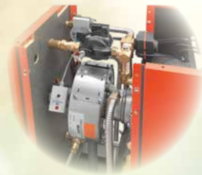
Abb. Ausf. Premium