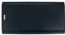
17 Füllraumschutzblech oben • Passend für Eventura HVL 2.0