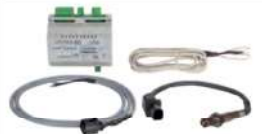
30 Lambdasonde • Passend für Eventura • Mit Modul HVL 2.0 PKL und PKKL