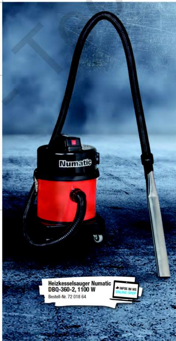
Heizkesselsauger Numatic DBQ-360-2, 1100 W