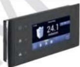
33 Touch Display • Passend für Eventura HVL 2.0 und HV