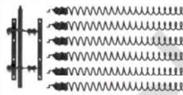
22 Reinigungsmechanismus • Passend für Eventura HVL 2.0 • Leistung: 20 kW