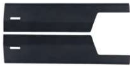
19 Füllraumschutzblech vorne rechts/links • Passend für Eventura HVL 2.0