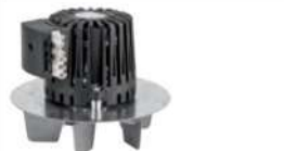
28 Rauchgasgebläsemotor • Passend für Eventura HVL 2.0 und HV • Mit Lüfterrad