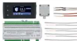
36 Komplettsset Igneo Touch I und HVL • Mit Sensoren und Big Modul